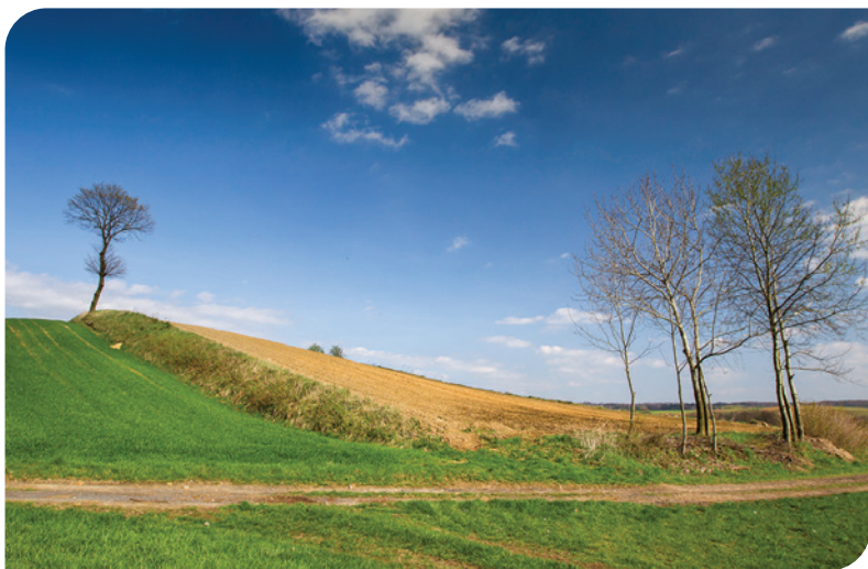
DĄB SZYPUŁKOWY NA MIEDZY

Po minięciu wiaty obserwacyjnej , po lewej stronie na wysokiej miedzy rośnie samotny dąb szypułkowy o nietypowym pokroju. Jako jeden z nielicznych punktów górujących nad terenem, pełni rolę czatowni dla ptaków. To z jego szczytu myszolowy czy pustułki potrafią wypatrzeć gryzonie nawet z kilkuset metrów. Dąb prawdopodobnie kilkadziesiąt lat temu posadziła sójka . Ptak ten robi zapasy na zimę chowając żołędzie i czasem o nich zapomina. Z zakopanego w ziemi żołędzia wyrasta czasem młody dąb. Owoce dębu może wynieść nawet na odległość 500 metrów. Co więcej, sójka za jednym razem potrafi zabrać ze sobą nawet do 5-ciu połkniętych żołędzi. W ciągu roku przenosi ich nawet od 4,5 do 11-stu tysięcy! Obecnie żołędzie tego drzewa roznoszone i chowane są przez kolejne sójki . Czasami są też pokarmem dla gryzoni żyjących na pobliskim polu. Poniżej dębu swoją norę, która może mieć nawet 15 metrów długości, wykopał lis . Jednym z jego ulubionych pokarmów są wcześniej wspomniane gryzonie. Wśród pól możemy zauważyć barwne kwiaty chwastów polnych – chabrów bławatków, maków czy rumianku.