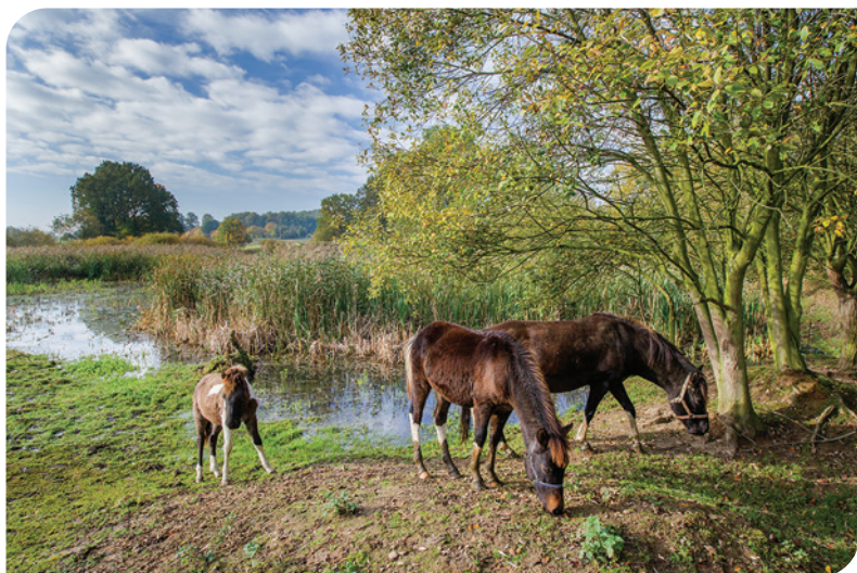
STAWY I WYPAS KONI

Po lewej stronie teren znacznie się podnosi , a pola poprzecinane są licznymi miedzami, przyjmującymi formę schodkową. Wiele z nich porośniętych jest krzewami obfitującymi w nasiona i owoce, którymi żywią się nie tylko ptaki, lecz także owady i gryzonie. Na polach z miedzami żyje dwukrotnie więcej gatunków zwierząt, niż w monokulturach. W praktyce miedza stanowi sąsiedzką granicę. Konflikt o miedzę stanowi jeden z motywów polskiej kultury, jak np. w powieści „ Ogniem i mieczem ”, czy filmie fabularnym „ Sami swoi ”. Najniższy punkt w dolinie Boćka porośnięty jest trzcinowiskiem z towarzyszącymi olchami czarnymi . Jest to typowy wskaźnik wilgotnego środowiska. Trzcinowisko stanowi doskonałe schronienie nie tylko dla sarny ale też dla ważącego zaledwie 9 g małego strzyżyka . Z kłosów natomiast ptaki mają szansę wydziobać pokarm. Na południowej granicy ZPK Bociek znajduje się kilka niewielkich stawów porośniętych trzcinowiskami, z których rozbrzmiewa śpiew trzciniaka i jego mniejszego kuzyna trzcinniczka . Na ich skraju bardzo często można zaobserwować nieśmiałą kokoszkę zwaną kurką wodną. W sąsiedztwie stawów wypasane są konie , które zgrzając trawę zapobiegają sukcesji , czyli zarastaniu łąk. Z błotnistych