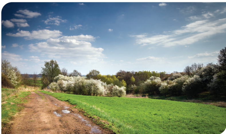
BYŁY UE BOCIEK

Las odgradzony jest niewielkim ciekiem wodnym przepływającym dalej przez były Użytek Ekologiczny Bociek, który w minionych latach całkowicie zarósł. Aby odbudować walory przyrodnicze tego terenu, w 2019 roku zaczęto tutaj prowadzić ochronę czynną . Prace rozpoczęto od wykarczowania zadrzewienia