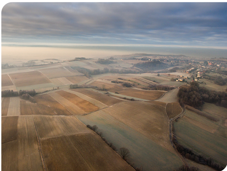
WIDOK NA POGRZEBIEN

Polna droga doprowadza nas na sam szczyt wzniesienia do ulicy Wiejskiej, gdzie dalszą trasę będziemy pokonywać drogą asfaltową. Stanowi ona północną granicę ZPK Bociiek. Już na początku – niczym przez wrota – przejdziemy niewielkim wąwozem i towarzyszącą mu aleją dębową . Na jego brzegach widać wystające korzenie, które niczym zbrojenie zapobiegają jego zniszczeniu. Po dojściu do kolejnego zadrzewienia, warto zejść trochę ze ścieżki aby móc podziwiać widok na Płaskowyz Rybnicki łącznie ze stawami na Wielikącie . Przy dobrej widoczności podziwiać możemy czeskie góry z najwyższym szczytem Beskidu Morawsko-Śląskiego – Łysą Horą (1324 m n.p.m.).