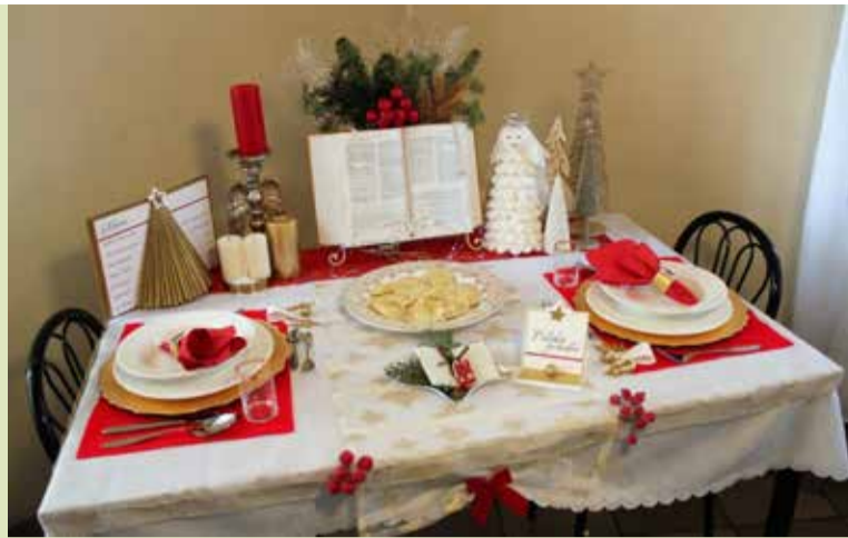
Przykład ładnego nakrycia stołu, w tym dniu obowiązkowy

https://pow.dzierzoniow.pl/najpiekniejsze-stoly-wigilijne.html