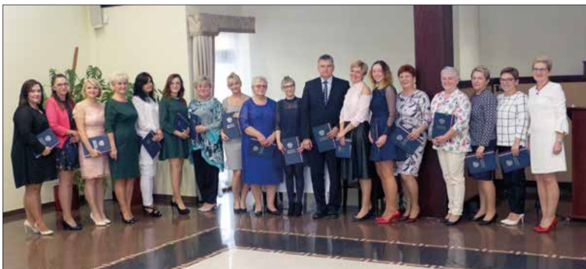
Nagrodzeni nauczyciele i pracownicy obsługi Zespołu Szkolno – Przedszkolnego w Kobylu