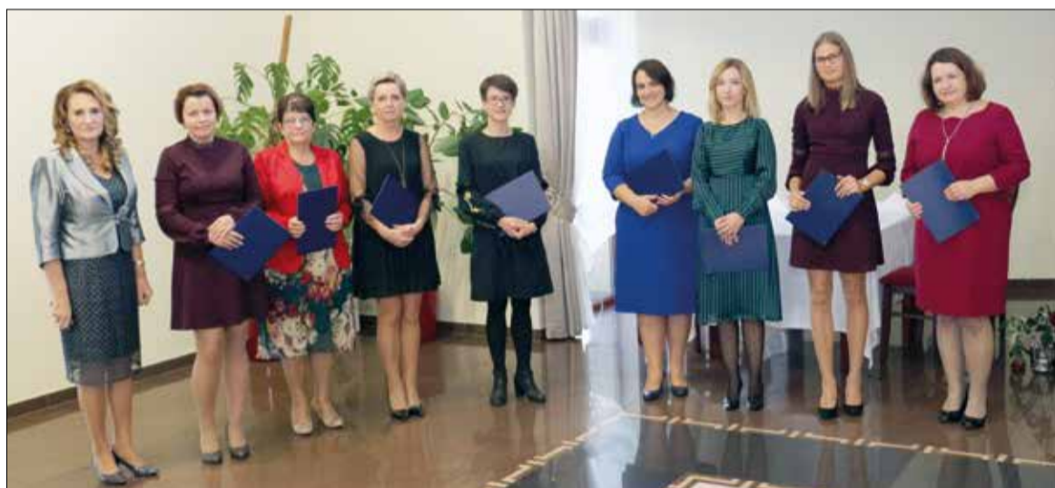
Nagrodzeni nauczyciele i pracownicy obsługi Szkoły Podstawowej w Kornowacu