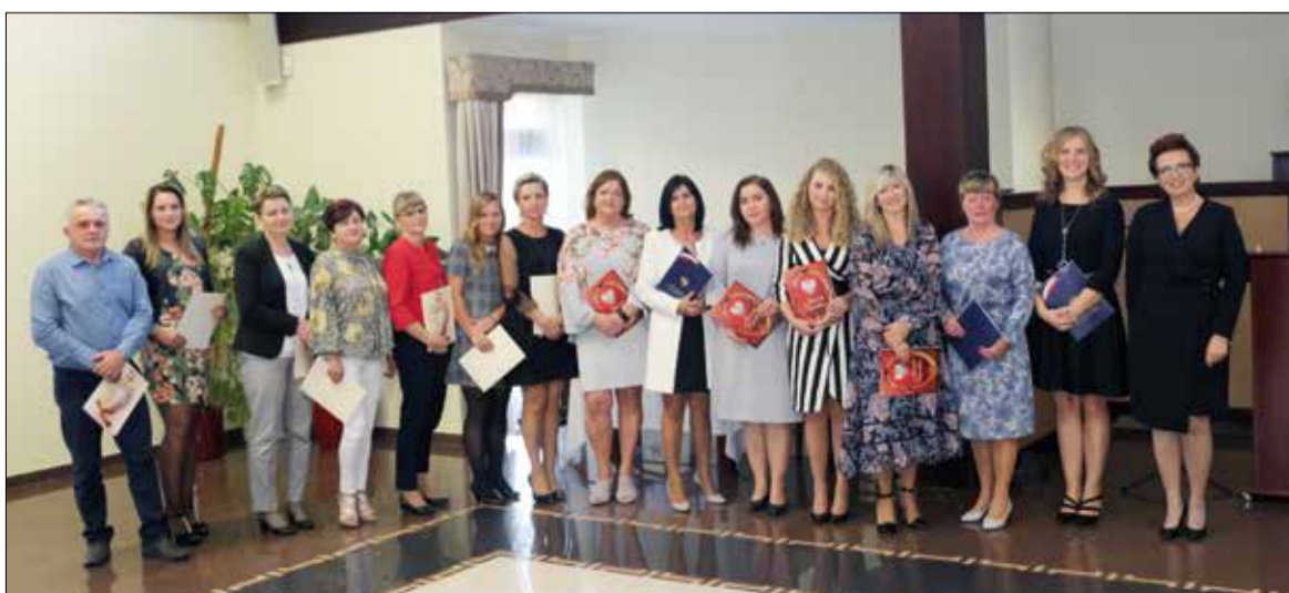
Nagrodzeni nauczyciele i pracownicy obsługi Zespołu Szkolno – Przedszkolnego w Pogrzebieniu