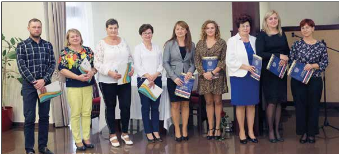
Nagrodzeni nauczyciele i pracownicy obsługi Zespołu Szkolno – Przedszkolnego w Rzuchowie

14 października, odbyły się pod patronatem Wójty oraz Zarządu Związku Nauczycielstwa Polskiego Oddział w Kornowacu uroczyste obchody Dnia Edukacji Narodowej w naszej Gminie. Spotkanie wszystkich pracowników gminnej oświaty było jak zwykle okazją do złożenia życzeń, podziękowań oraz przekazania nagród i wyróżnień.