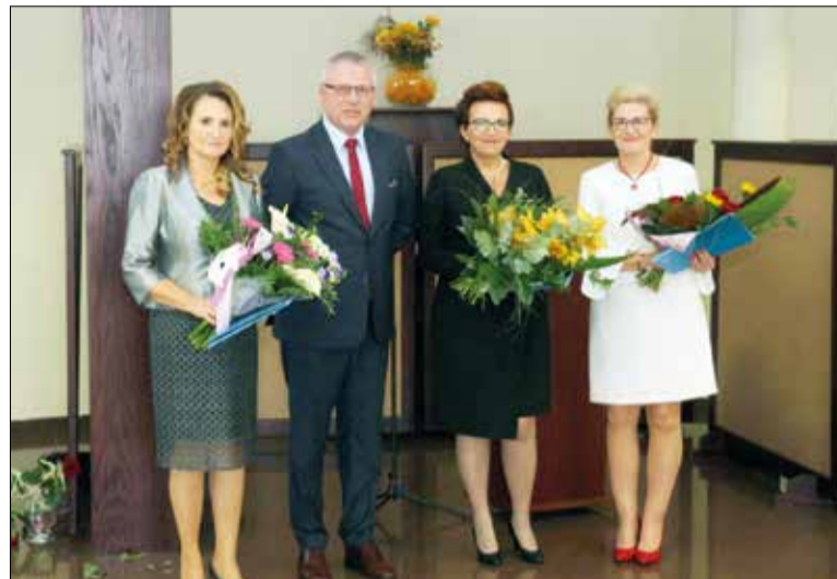
Nagrodzeni Dyrektorzy placówek oświatowych z Wójtem Gminy Kornowac