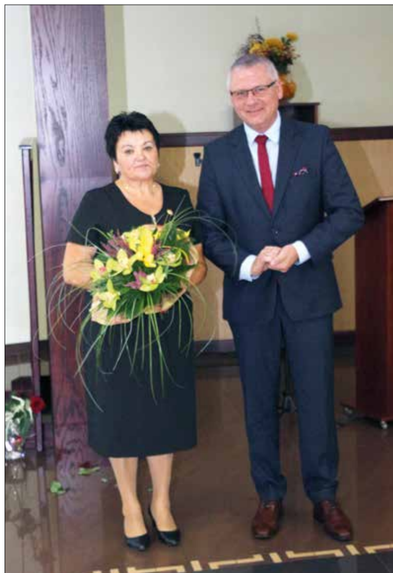
Prezes ZNP w Kornowacu z Wójtem Gminy Kornowac