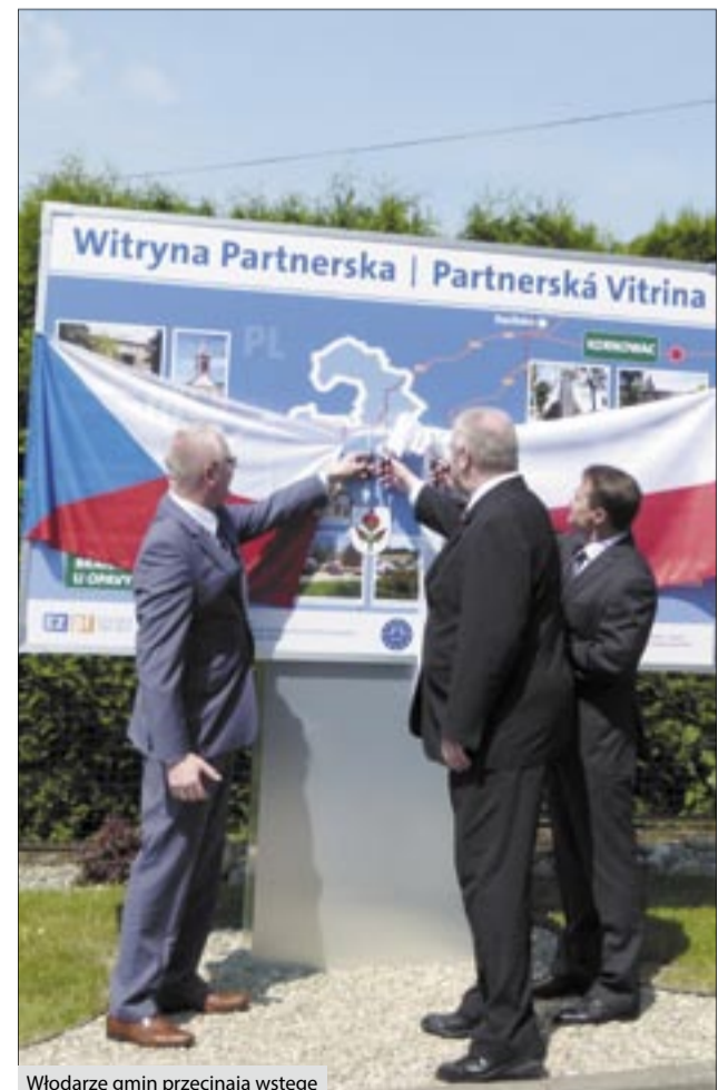
Włodarze gmin przecinają wstęgę