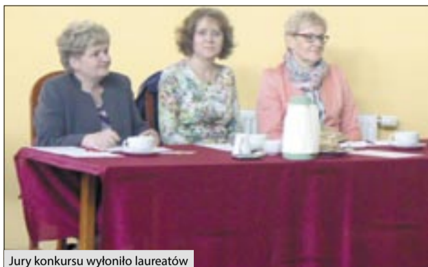
Jury konkursu wyłoniło laureatów