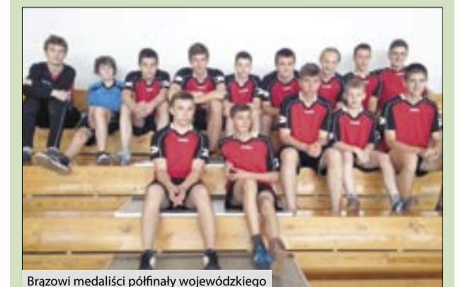
Brązowi medaliści półfinału wojewódzkiego

14-osobowa reprezentacja naszego gimnazjum, po zwycięstwach w turnieju powiatowym i rejonowym, awansowała do półfinału wojewódzkiego w piłce ręcznej chłopców, który odbył się 12 maja w Wodzisławiu Śląskim. Do zawodów przystąpiły cztery drużyny: gospodarzy, Żor, Bystrej oraz gimnazjaliści z Kornowacu. Po losowaniu nasi chłopcy, jako drudzy wy-