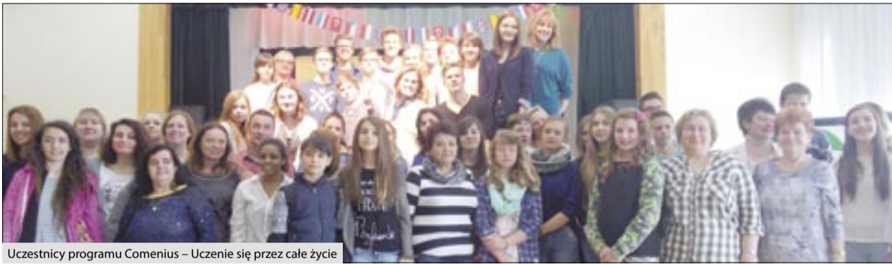
Uczestnicy programu Comenius – Uczenie się przez całe życie

Od 18 do 22 maja w Balvi na Łotwie miało miejsce ostatnie już – siódme – spotkanie partnerów projektu współpracy szkół „Health is Wealth”. Projekt realizowany jest w latach 2013 – 2015 przez siedem szkół, w tym Gimnazjum im. Jana Pawła II w Kornowacu, z dofinansowaniem UE w ramach programu Comenius – „Uczenie się przez całe życie”.