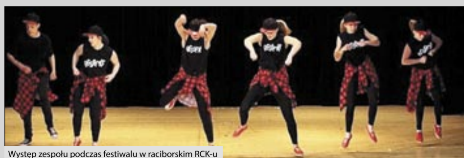
Występ zespołu podczas festiwalu w raciborskim RCK-u