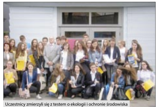
Uczestnicy zmierzli się z testem o ekologii i ochronie środowiska