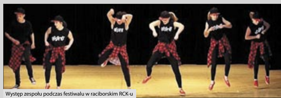
Występ zespołu podczas festiwalu w raciborskim RCK-u