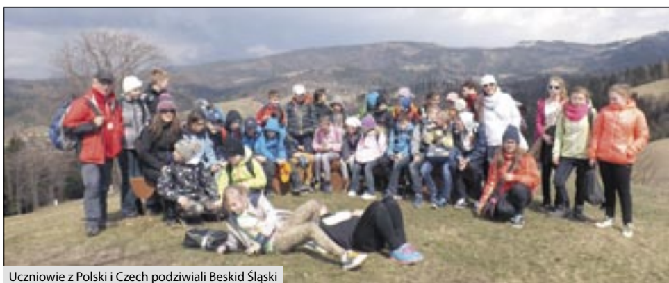
Uczniowie z Polski i Czech podziwiali Beskid Śląski