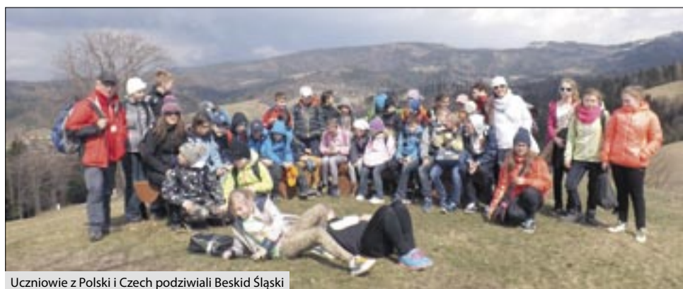
Uczniowie z Polski i Czech podziwiali Beskid Śląski