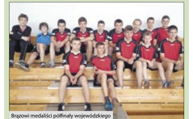
Brązowi medaliści półfinału wojewódzkiego

14-osobowa reprezentacja naszego gimnazjum, po zwycięstwach w turnieju powiatowym i rejonowym, awansowała do półfinału wojewódzkiego w piłce ręcznej chłopców, który odbył się 12 maja w Wodzisławiu Śląskim. Do zawodów przystąpiły cztery drużyny: gospodarzy, Żor, Bystrej oraz gimnazjaliści z Kornowaca. Po losowaniu nasi chłopcy, jako drudzy wy-