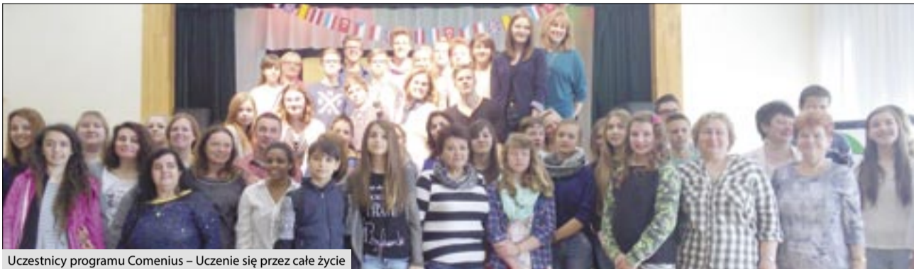
Uczestnicy programu Comenius – Uczenie się przez całe życie

Od 18 do 22 maja w Balwi na Łotwie miało miejsce ostatnie już – siódme – spotkanie partnerów projektu współpracy szkół „Health is Wealth”. Projekt realizowany jest w latach 2013 – 2015 przez siedem szkół, w tym Gimnazjum im. Jana Pawła II w Kornowacu, z dofinansowaniem UE w ramach programu Comenius – „Uczenie się przez całe życie”.