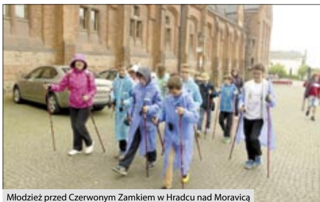
Młodzież przed Czerwonym Zamkiem w Hradcu nad Morawicą