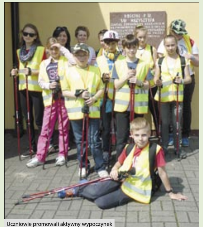
Uczniowie promowali aktywny wypoczynek