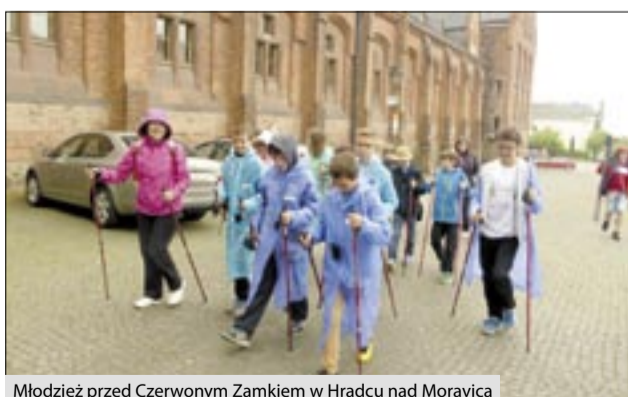
Młodzież przed Czerwonym Zamkiem w Hradcu nad Morawicą