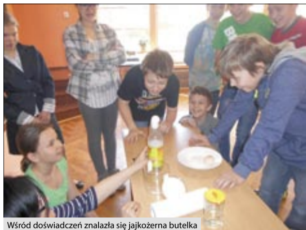
Wśród doświadczeń znalazła się jajkożerna butelka

W związku ze zbliżającym się Dniem Ziemi w Szkole Podstawowej w Pogrzebieniu odbył się Gminny Konkurs Ekologiczno-Przyrodniczy. Celem konkursu było popularyzowanie wiedzy przyrodniczej i ekolo-