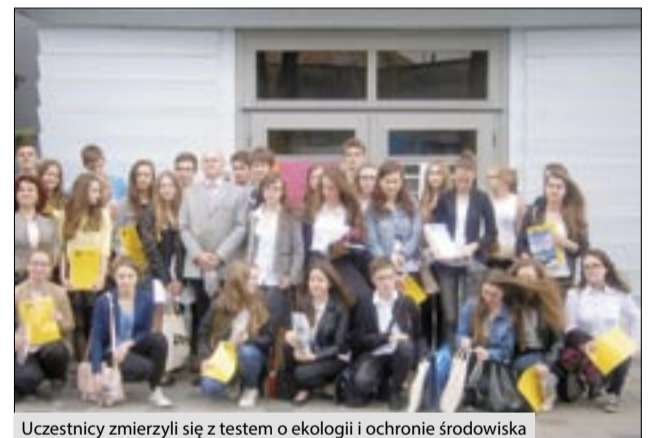
Uczestnicy zmierzili się z testem o ekologii i ochronie środowiska