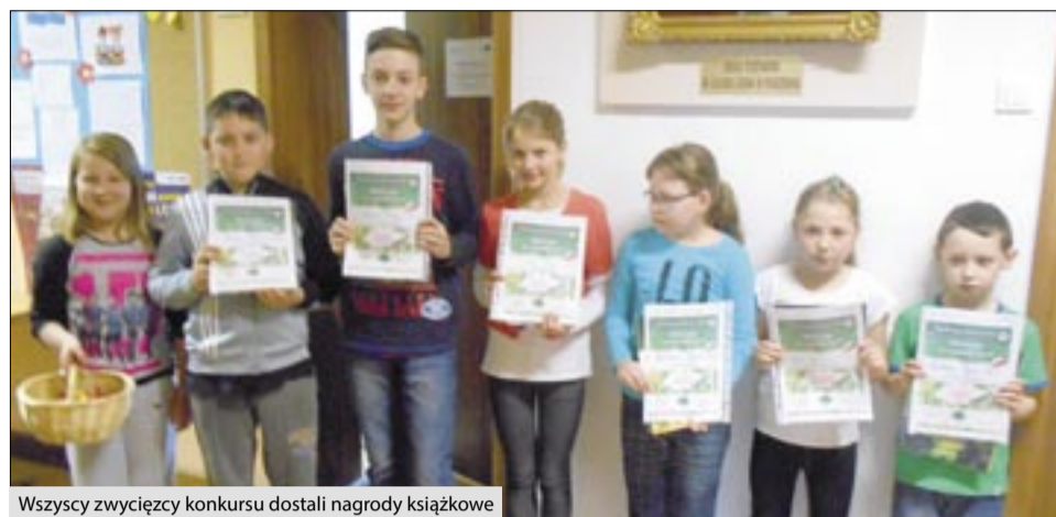
Wszyscy zwycięzcy konkursu dostali nagrody książkowe