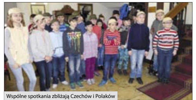
Wspólne spotkania zblizaj Czechow i Polakow

Zespół Szkolno-Przed-szkolny w Rzuchowie we współpracy z Zakładni Skoła w Brance u Opawy rozpoczął realizację drugiego już projektu pt.: „Polsko-Czeska wędrówka po okolicy” współfinansowanego z Europejskiego Funduszu Regionalnego oraz budżetu państwa RP w ramach Programu Operacyjnego Współpracy Transgranicznej Republika Czeska – Rzeczpospolita Polska 2007 – 2013.