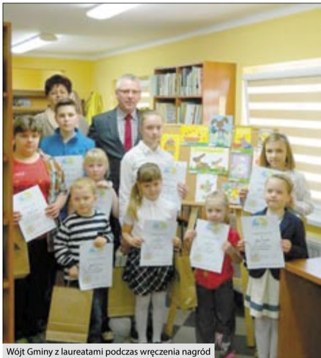
Wójt Gminy z laureatami podczas wręczenia nagród