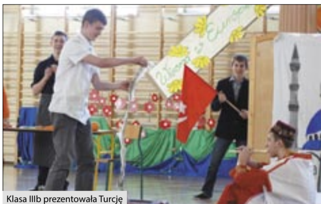
Klasa IIIb prezentowała Turcję

W sobotę 21 marca w Gimnazjum im. Jana Pawła II w Kornowacu miało miejsce powitanie wiosny poprzez prezentacje krajów europejskich, połączone z dniem otwartym w szkole. Gimnazjum powróciło do swojej dawnej tradycji „Wiosny w Europie”. Przedstawione zostały kraje naszych sześciu partnerów projektu Comenius, realizowanego w latach 2013 – 2015 w ramach programu UE Uczenie się przez całe życie.