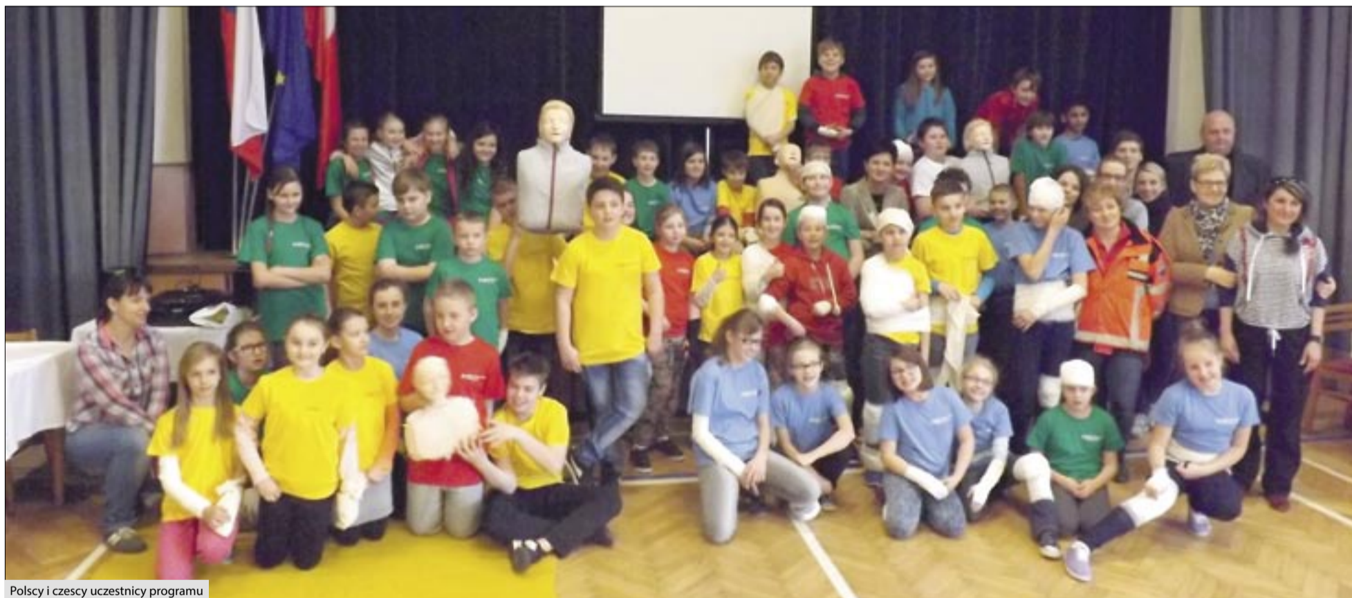
Polscy i czeszy uczestnicy programu

24 marca dyrekcja, nauczyciele oraz uczniowie szkoły w Kobyli wyruszyli do Komarowa, gdzie odbyło się III działanie projektu pt. „112 bezpieczeństwo bez granic” realizowanego w ramach Funduszu Mikroprojektów w Euroregionie Silesia. Działanie nosiło tytuł „Udzielamy