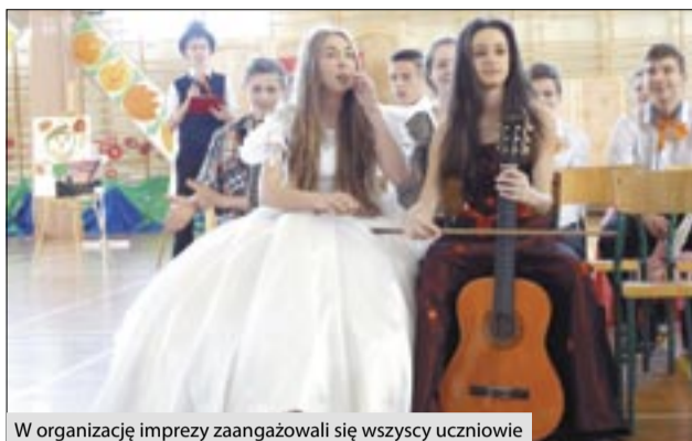
W organizację imprezy zaangażowali się wszyscy uczniowie

chy, IIb – Hiszpanię, IIIa – Holandię i IIIb – Turcję. W przygotowanie występów – scenariuszy, strojów, występów na scenie, piosenek, podkładów muzycznych, prezentacji multimedialnych, dań kuchni poszczególnych krajów – zaangażowani zostali wszyscy uczniowie szkoły, wychowawcy, nauczyciele, a także wielu rodziców. Program rozpoczął się po godzinie prób i przygotowań w klasach i trwał od godziny 9.00 do 12.30. Występy były pełne życia, ruchu, żartów i smakołyków, więc nikt się nie nudził. Bardzo podobały