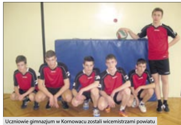
Uczniowie gimnazjum w Kornowacu zostali wicemistrzami powiatu