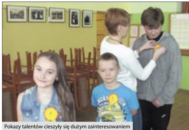
Pokazy talentów cieszyły się dużym zainteresowaniem

Występy wzbudziły wielki entuzjazm, były niebywałą atrakcją dla samych występujących i zaskoczeniem dla wielu oglądających. Kolejnym punktem programu były zawody sportowe, w których mieszane drużyny klas IV, V i VI musiały zmierzyć się w nietypowych konkurencjach. Wszyscy otrzymali pamiątkowe medale, a zabawa była przednia. Dodatkową atrakcją przygotowały panie z Domu Kultury w Kobyli