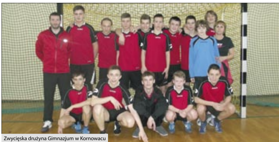
Zwycięska drużyna Gimnazjum w Kornowacu

30 marca w Gimnazjum imienia Jana Pawła II w Kornowacu odbyły się gimnazjalne finały rejonowe w piłce ręcznej chłopców. Do turnieju przystąpiły 4 drużyny z: Piec, Czuchowa, SMS w Raciborzu i Kornowaca – gospodarza imprezy