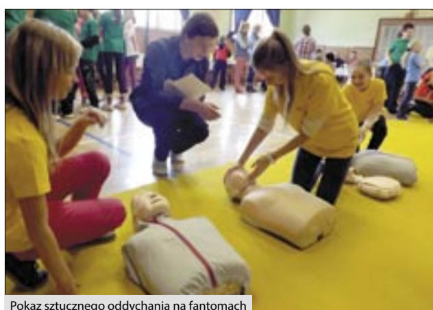
Pokaz sztucznego oddychania na fantomach