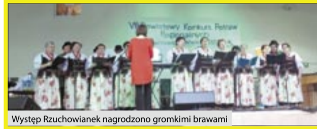
Występ Rzuchowianek nagrodzono gromkimi brawami