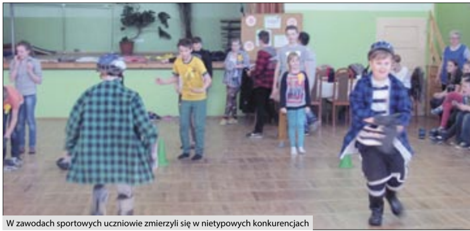
W zawodach sportowych uczniowie zmierzili się w nietypowych konkurencjach

Ostatniego dnia zimy, w piątek 20 marca, tradycyjnie jak co roku w szkole w Kobyli powitano wiosnę. Z tej okazji w szkole odbył się pokaz talentów. Pokaz cieszył się dużym zainteresowaniem. Uczniowie wytrwale przygotowywali się do zaprezentowania swoich pasji, osiągnięć, talentów, hobby, tańczyli, śpiewali, grali na instrumentach, dwaj młodzi hodowcy papug przynieśli pupile i opowiedzieli wszystkim o swoim hobby.