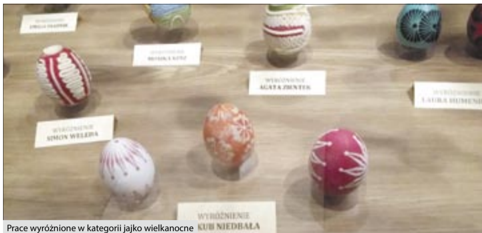
Prace wyróżnione w kategorii jajko wielkanocne