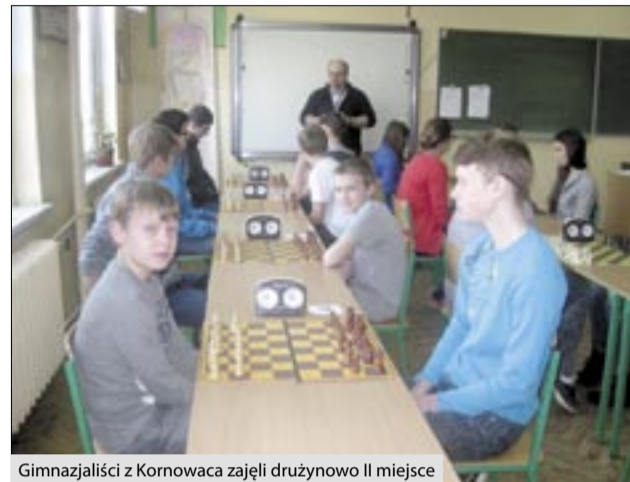
Gimnazjaliści z Kornowaca zajęli drużynowo II miejsce