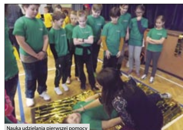
Nauka udzielania pierwszej pomocy