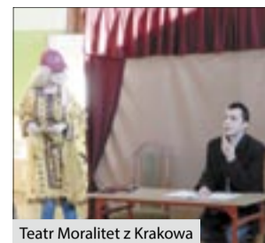
Teatr Moralitet z Krakowa

Gminna Biblioteka Publiczna zaprosiła Teatr Moralitet z Krakowa ze spektaklem o charakterze profilaktyczno-edukacyjnym pt. „Bella”. Przedstawienie obejrżeli uczniowie Szkół Podstawowych z Kobyli i Pogrzebienia. Tematem przewodnim było przeciwdziałanie agresji, przemocy nie wykluczając cyberprzemocy. Aktorzy uświadamiali młodym ludziom, że osoba prześladowana nie musi być sama, a opowiedzenie o tym, nauczycielowi czy innej osobie dorosłej, to nie jest „kablowanie”, ale wręcz przeciwnie może pomóc a nawet zapobiec tragedii. W trak-