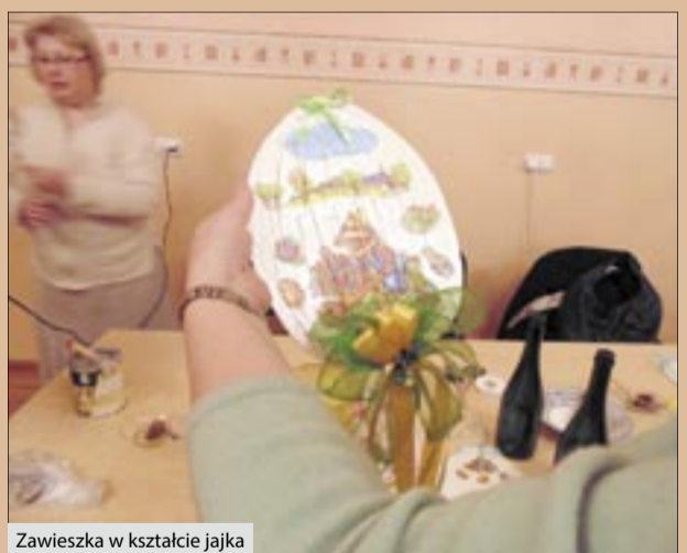
Zawieszka w kształcie jajka