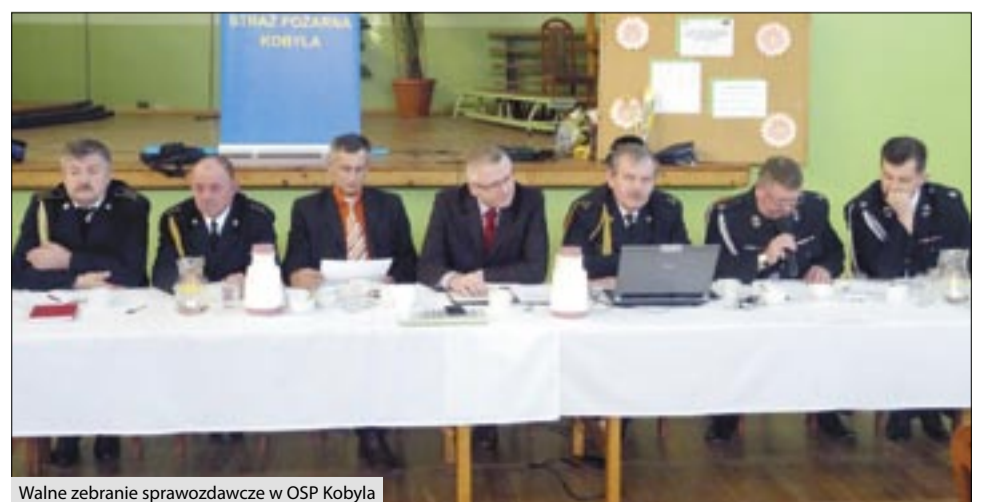
Walne zebranie sprawozdawcze w OSP Kobyla