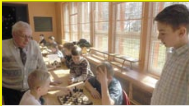
Na Gminny Turniej Szachowy i Warcabowy przyjechali uczniowie z trzech szkół