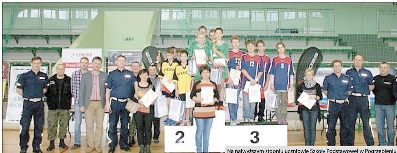
Na najwyższym stopniu uczniowie Szkoły Podstawowej w Pogrzebieniu