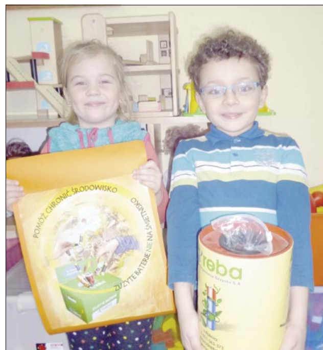
Przedшкоlaki z Rzuchowa wymieniają zużyte baterie na artykuły papirnicze

Wszystkie przedszkolaki z Rzuchowa wiedzą, co należy zrobić ze zużytymi bateriami! Od lat nasze przedszkole zbiera nikomu niepotrzebne zużyte baterie. W ten sposób uczymy dzieci chronić środowisko naturalne. Ponadto za zbiórkę zużytych baterii przedszkole zbiera punkty w sklepie IKEA wymienne