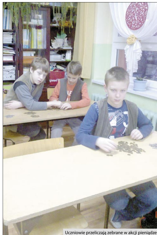
Uczniowie przeliczają zebrane w akcji pieniądze

Tradycyjnie jak co roku przystąpiliśmy do ogólnopolskiej akcji GÓRA GROSZA. Finał zbiórki miał miejsce w grudniu 2014 r.