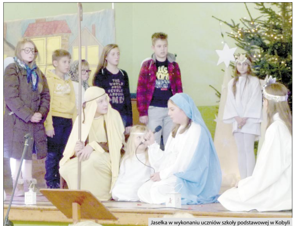
Jasełka w wykonaniu uczniów szkoły podstawowej w Kobyli