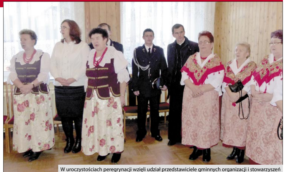
W uroczystościach peregrynacji wzięli udział przedstawiciele gminnych organizacji i stowarzyszeń