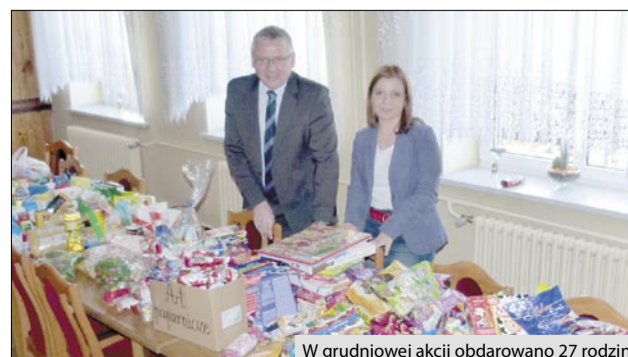
W grudniowej akcji obdarowano 27 rodzin

Wszystkim, którzy zaangażowali się w świąteczną zbiórkę żywności, wójt gminy Kornowac oraz kierownik Ośrodka Pomocy Społecznej w Kornowacu składają serdeczne podziękowania.