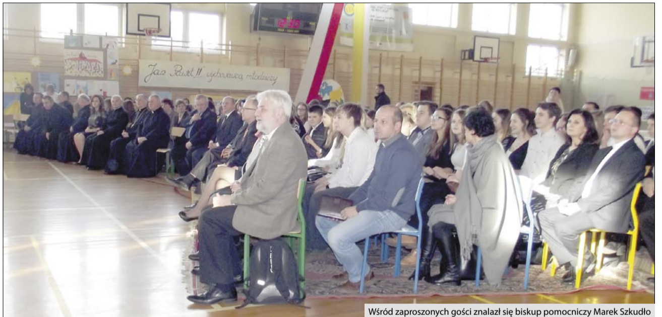
Wśród zaproszonych gości znalazł się biskup pomocniczy Marek Szkudło