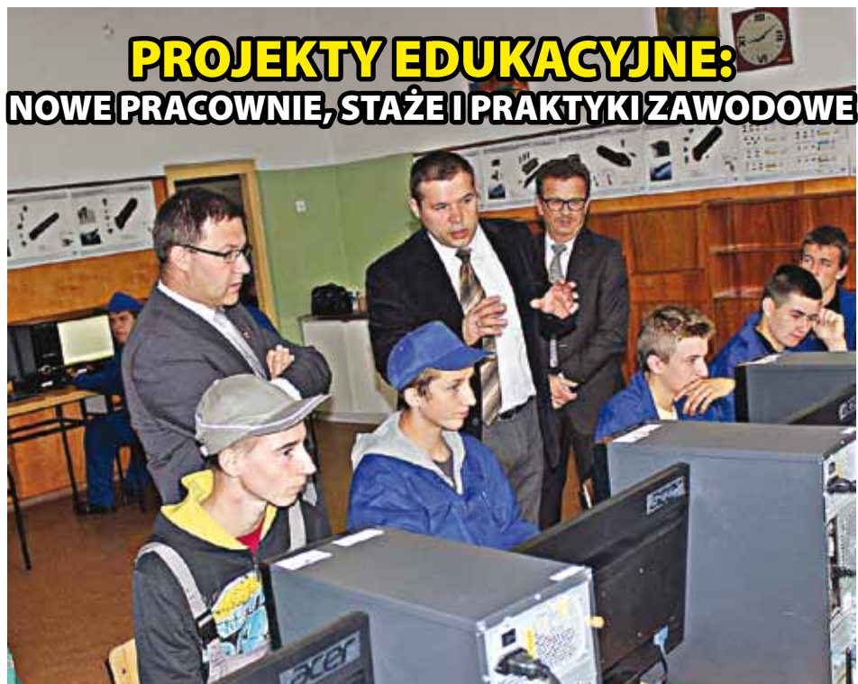
PROJEKTY EDUKACYJNE: NOWE PRACOWNIE, STAŻE I PRAKTYKI ZAWODOWE

Powiat wraz ze szkołami średnimi realizuje w tej kadencji trzy projekty, w których uczestniczą nauczyciele i kilkuset uczniów. Ich celem jest zdobycie nowych umiejętności, podniesienie kwalifikacji, praktyki i staże u lokalnych przedsiębiorców, a także wyposażenie pracowni szkolnych: „Od pomysłu do sukcesu” - 1 417 695,60 zł , „Nowe umiejętności szansą na sukces” - 1 927 237,67 zł , „Pewnym krokiem w przyszłość” - 1 439 294,40 zł .