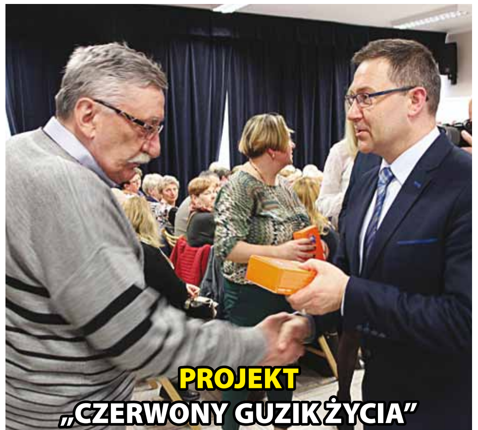
PROJEKT „CZERWONY GUZIK ŻYCIA”

Powiat wraz ze szkołami średnimi realizuje w tej kadencji trzy projekty, w których uczestniczą nauczyciele i kilkuset uczniów. Ich celem jest zdobycie nowych umiejętności, podniesienie kwalifikacji, praktyki i staże u lokalnych przedsiębiorców, a także wyposażenie pracowni szkolnych: „Od pomysłu do sukcesu” - 1 417 695,60 zł , „Nowe umiejętności szansą na sukces” - 1 927 237,67 zł , „Pewnym krokiem w przyszłość” - 1 439 294,40 zł .