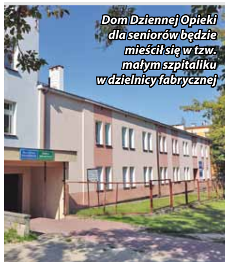
Dom Diennej Opieki dla seniorów będzie mieścił się w tzw. małym szpitaliku w dzielnicy fabrycznej