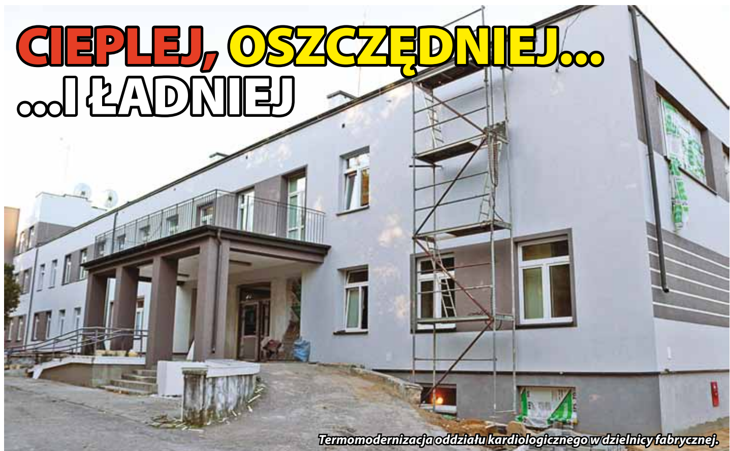
Termomodernizacja oddziału kardiologicznego w dzielnicy fabrycznej.

W przyszłym roku planujemy dookończenie modernizacji powiatowych obiektów szkolnych na terenie Kraśnika, czyli termomodernizację budynku „Reja” oraz budowę nowych boisk przy ZS nr 3