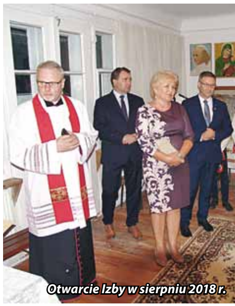
Otwarcie Izby w sierpniu 2018r.