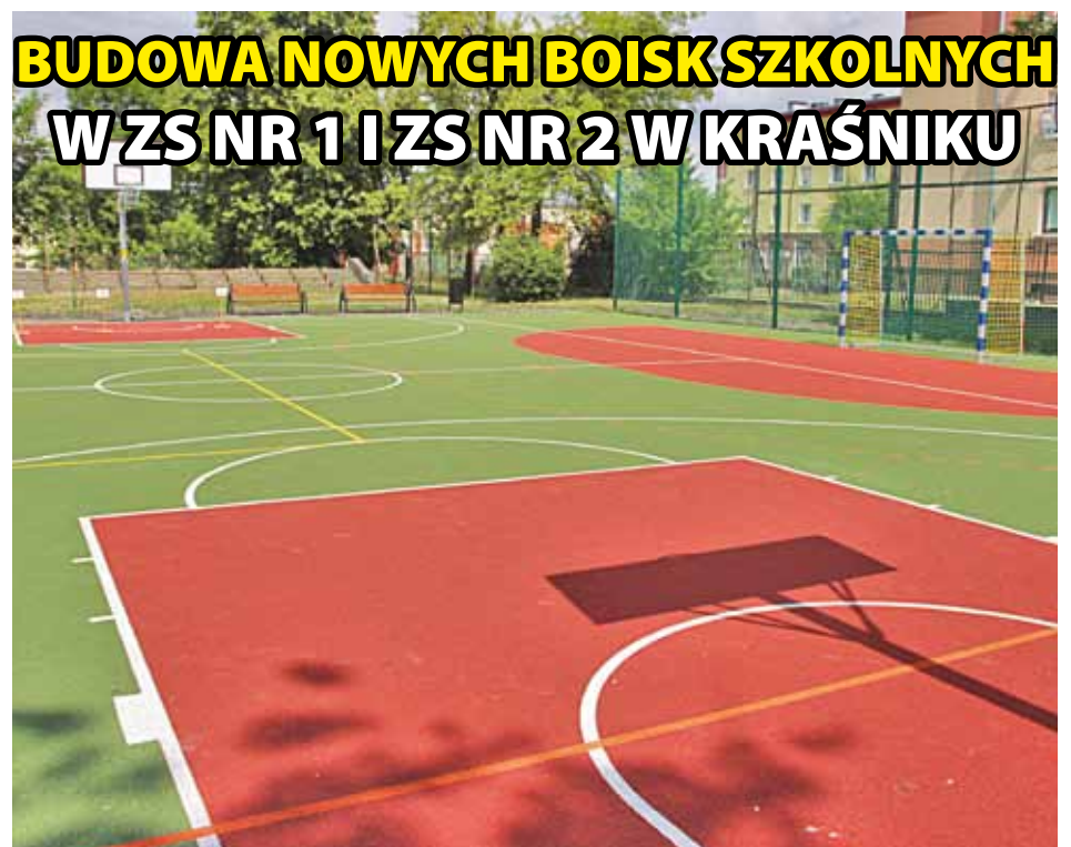
BUDOWA NOWYCH BOISK SZKOLNYCH W ZS NR 1 I ZS NR 2 W KRAŚNIKU

Koszt całego przedsięwzięcia to 6,6 mln zł . Dofinansowanie unijne wynosi 3 mln zł . Projekt zakłada powstanie 18 pracowni. Do końca października 2018 r. zostanie zbudowana hala w stanie surowym, a prace wykończeniowe i wyposażenie warsztatów w sprzęt do nauki zawodów potrwać do czerwca 2019 r. W nowoczesnych warsztatach kształceni będą uczniowie w siedmiu zawodach.