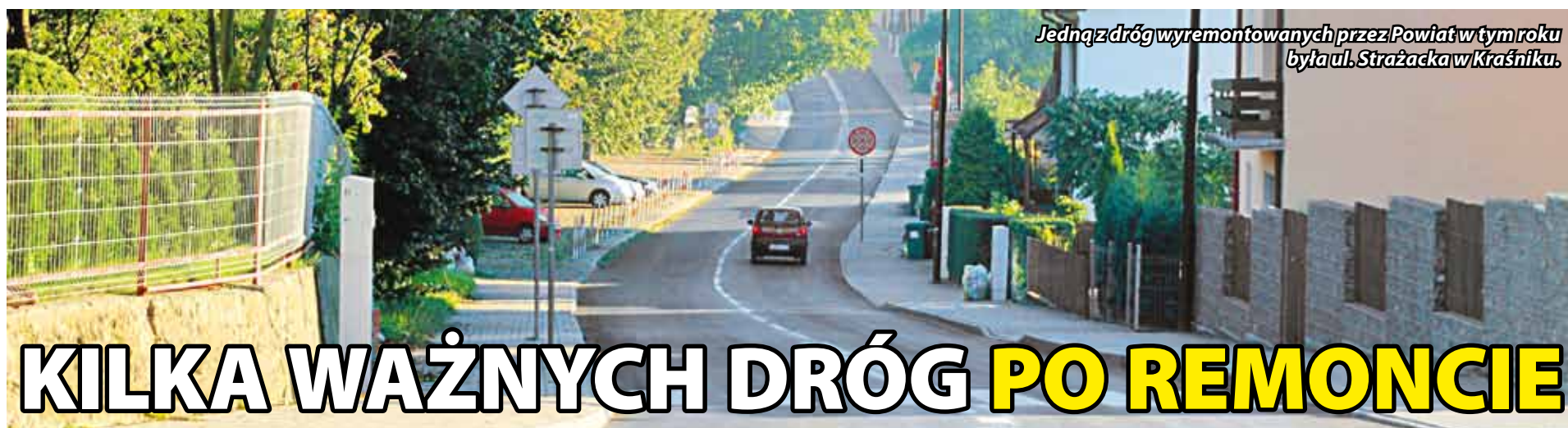
Jedną z dróg wyremontowanych przez Powiat w tym roku była ul. Strażacka w Kraśniku.