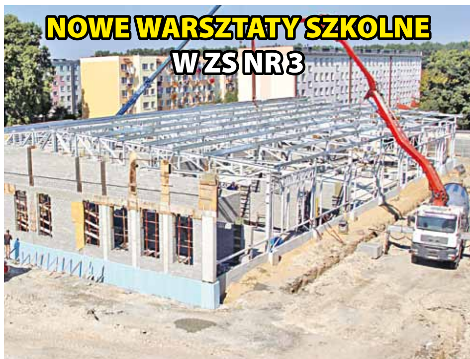
NOWE WARSZTATY SZKOLNE W ZS NR 3

Jego wartość to 883 970 zł , z czego dofinansowanie unijne wynosi 839 771 zł . 135 uczestników-seniorów zostało wyposażonych na dwa lata w bransoletki z tzw. „przyciskiem życia”, które pozwalają łączyć się z Centrum Zdalnej Opieki i w razie potrzeby wezwać pomoc medyczną.