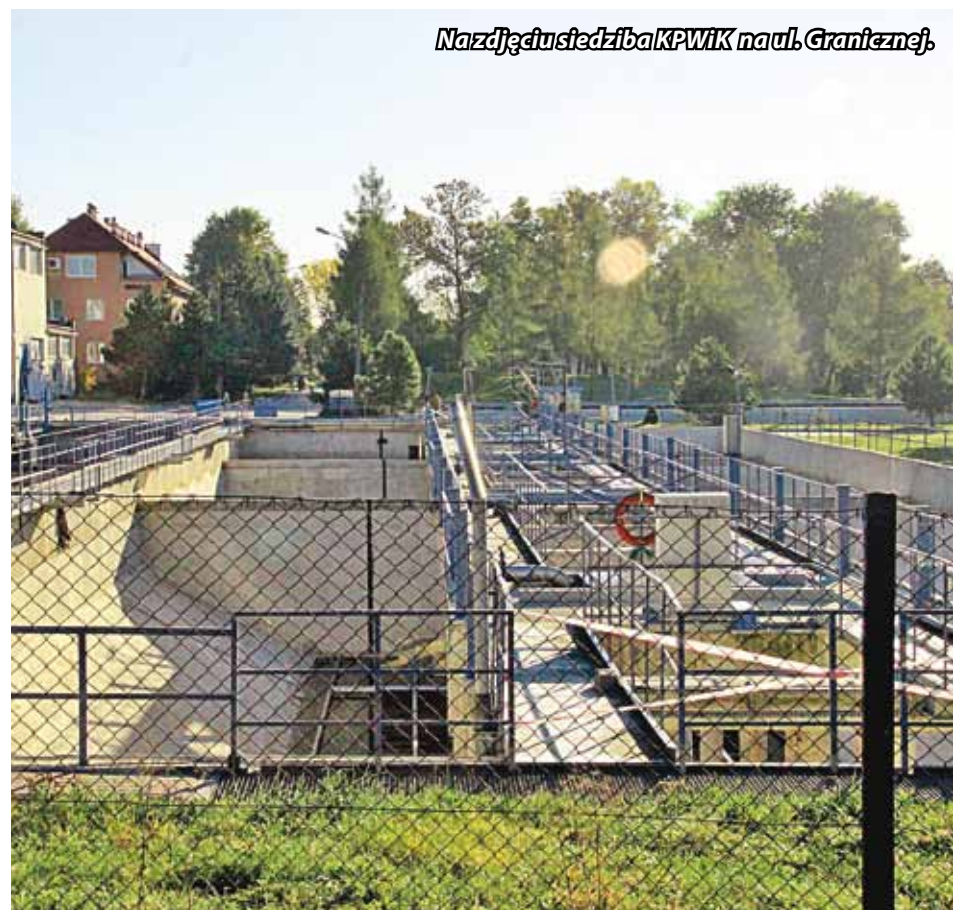
Nazdjęciostędziba KPWiK na ul. Granicznej.