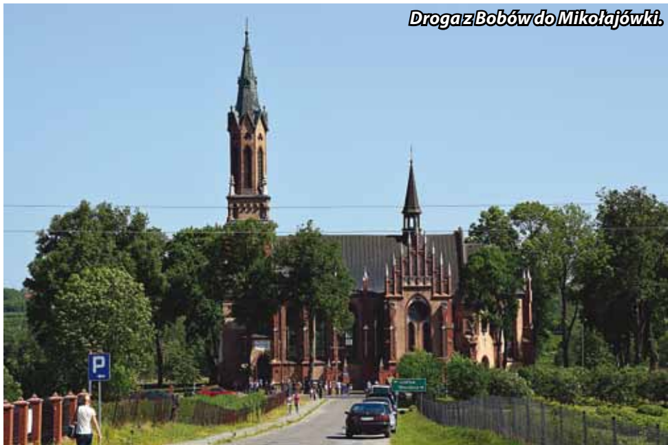
Droga z Bobów do Mikołajówki.