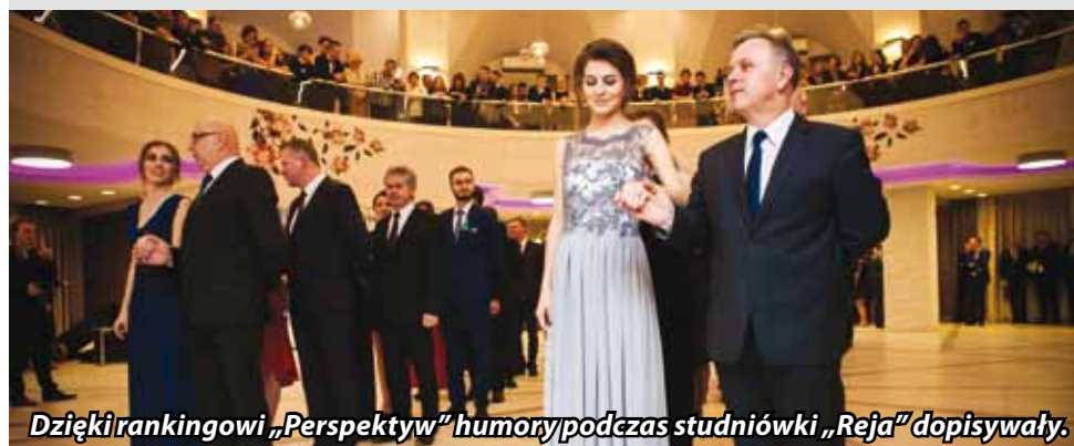
Dzięki rankingowi „Perspektywy” humory podczas studniówki „Reja” dopisywały.

W skład kapituły dokonującej oceny wchodzi władze wyższych uczelni, dyrektorzy Okręgowych Komisji Egzaminacyjnych oraz przedstawiciele komitetów głównych olimpiad. Warto również pochwalić absolwentów „rejowskiego” technikum ekonomicznego, którzy zajęli 18. miejsce wśród 50 techników ocenianych w województwie lubelskim.