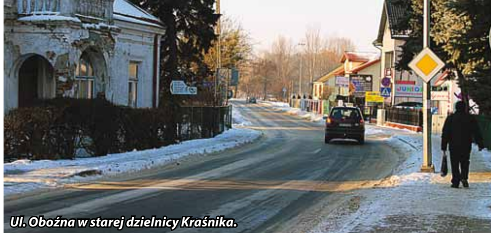
Ul. Oboźna w starej dzielnicy Kraśnika.