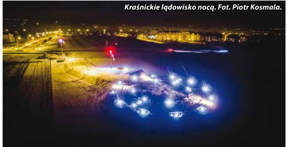
Kraśnickie lądowisko nocą.

Lądowisko wraz z ogrodzeniem, oświetleniem i drogą dojazdową znajduje się w okolicy kościoła pw. Miłosierdzia Bożego na Piaskach, kilka-