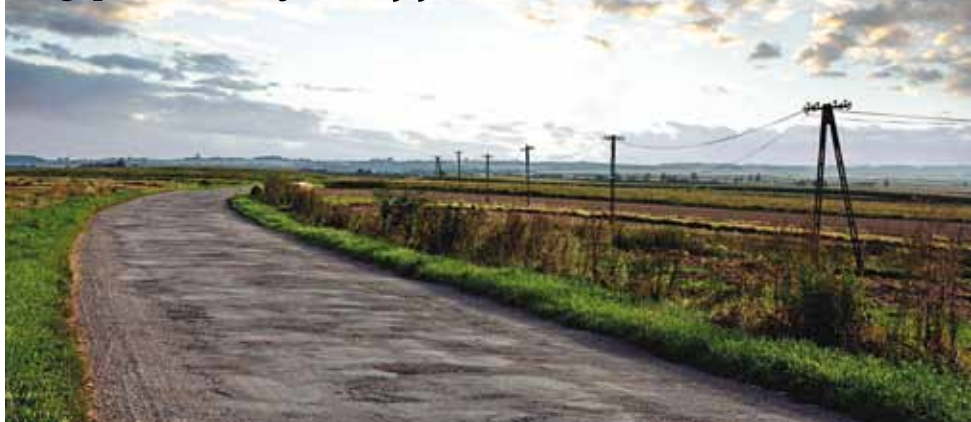
Droga przez Owczarnię do Rzeczyca.

Zakrzówek: drogi w Majdanie Grabina, Zakrzówku Wsi i Zakrzówku Nowym.