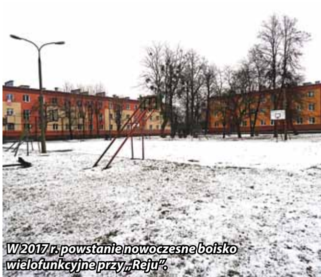
W 2017 r. powstanie nowoczesne boisko wielofunkcyjne przy „Reju”.