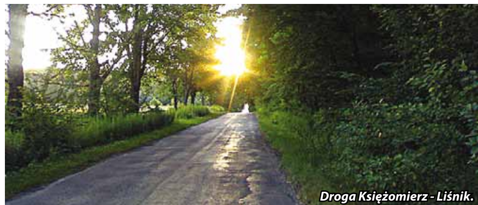
Droga Książomierz - Liśnik.

Planowane jest wykonanie chodników w miejscowościach Książomierz oraz Gościeradów.