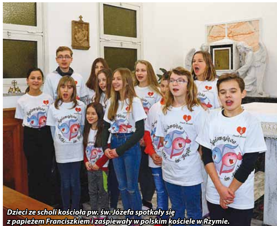
Dzieci ze scholi kościoła pw. św. Józefa spotkały się z papieżem Franciszkiem i zaśpiewały w polskim kościele w Rzymie.

W połowie stycznia dzieci i młodzież z Ruchu Opatrzności Bożej i Scholi „Śpiewające Nutki św. Józefa” udały się z pielgrzymką do Rzymu i Stolicy Apostolskiej. Młodzi kraśniczanie uczestniczyli w mszach św., m.in. przy grobie św. Jana Pawła II, spotkały się również z Ojcem Świętym Franciszkiem i wystąpiły w tamtejszym polskim kościele.