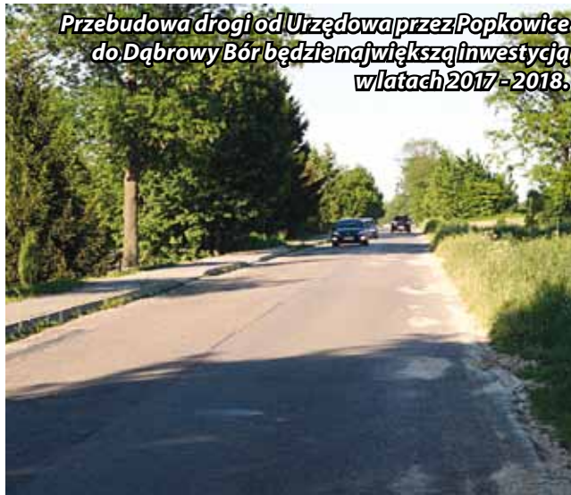
Przebudowa drogi od Urzędowa przez Popkowice do Dąbrowy Bór będzie największą inwestycją w latach 2017-2018.