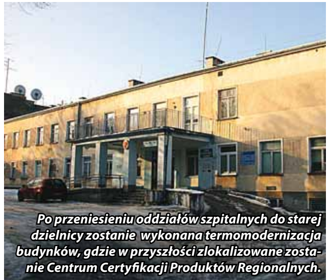
Po przeniesieniu oddziałów szpitalnych do starej dzielnicy zostanie wykonana termomodernizacja budynków, gdzie w przyszłości zlokalizowane zostanie Centrum Certyfikacji Produktów Regionalnych.