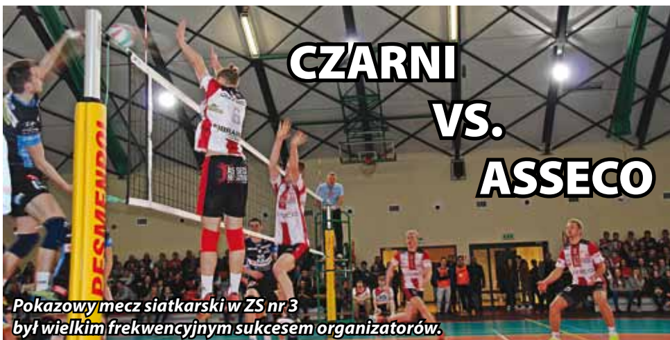
Pokazowy mecz siatkarski w ZS nr 3 był wielkim frekwencyjnym sukcesem organizatorów.

12 stycznia w hali sportowej ZS nr 3 w Kraśniku odbył się mecz towarzyski drużyn młodej ligi siatkarskiej. Na parkiecie wystąpili zawodnicy z Rzeszowa i Radomia.