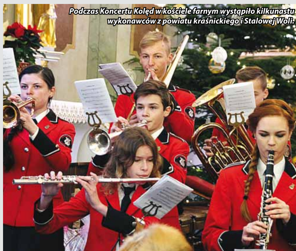
Podczas Koncertu Kolęd w kościele farnym wystąpiło kilkunastu wykonawców z powiatu kraśnickiego i Stalowej Woli.