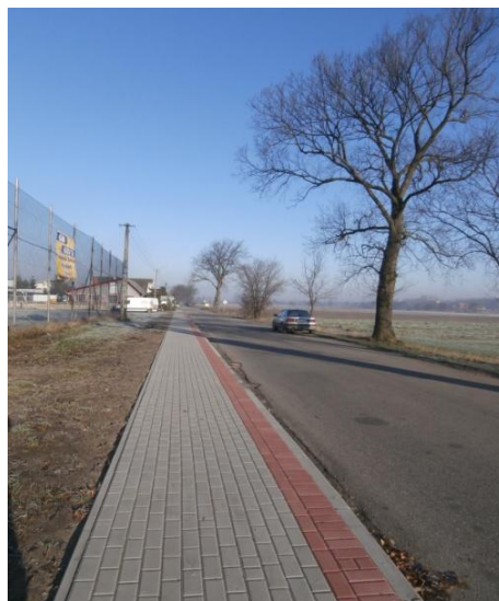
odcinek chodnika na ul. Ostrowskiej w Karminku