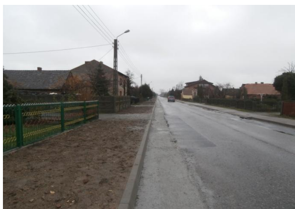
oraz poszerzył drogę powiatową w Galewie wraz z udrożnieniem kanalizacji deszczowej.