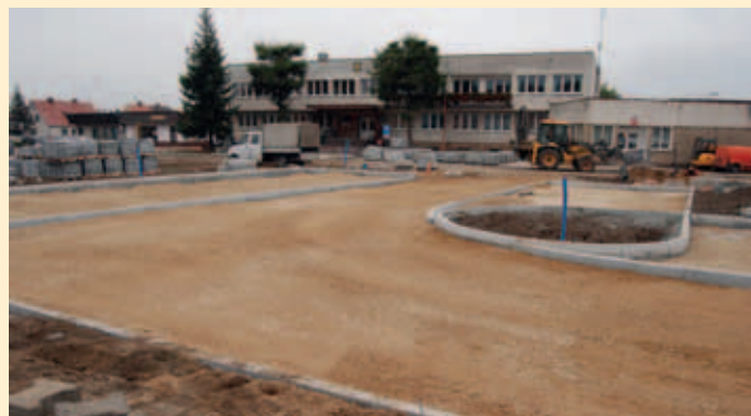
Plac przed Urzędem Gminy