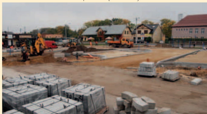
Plac przed Urzędem Gminy