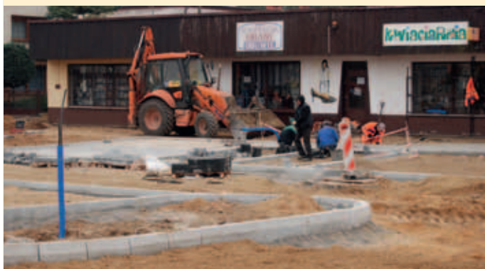
Plac przed Urzędem Gminy