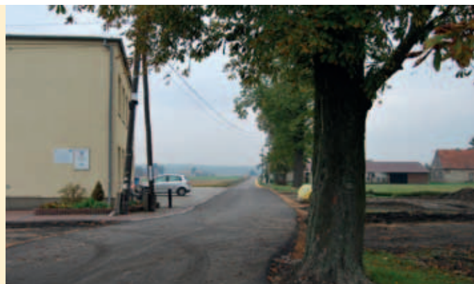
Molna ul. Tylna

Remont ulicy Tylnej w miejscowości Molna, w sąsiedztwie szkoły podstawowej, dofinansowany jest w ok. 80% ze środków Urzędu Wojewódzkiego w ramach dotacji na usuwanie skutków klęsk żywiołowych. W ramach robót nawierzchnia drogi wykonana zostanie z mieszanki mineralno-bitumicznej gr. 4cm – warstwa ścieralna, natomiast pobocze z tłuczni kamienno-gr. 10cm na szer. 0,5m obustronnie. Cała długość drogi wyniesie ok. 1km. Przebudowa obejmie także odwodnienie w sąsiedztwie szkoły podstawowej.