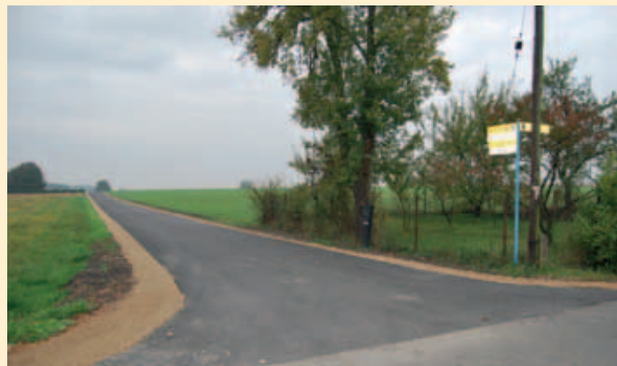
Molna ul. Polna

Na przedmiotową inwestycję, w wyniku złożonego przez Gminę wniosku, przyznano środki z Urzędu Marszałkowskiego w ramach Funduszu Ochrony Gruntów Rolnych. Powyższa droga ma długość 942m, posiada pobocza oraz stanowi dojazd do pól. Jej nawierzchnia pokryta jest asfaltem.