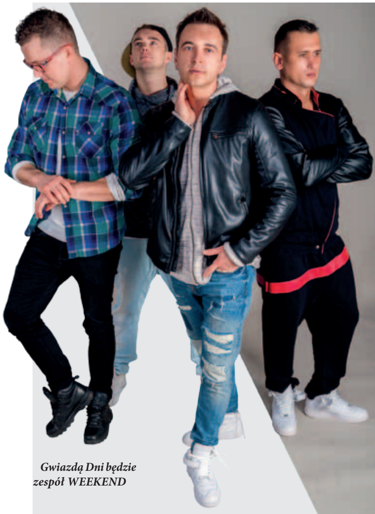
Gwiazdą Dni będzie zespół WEEKEND