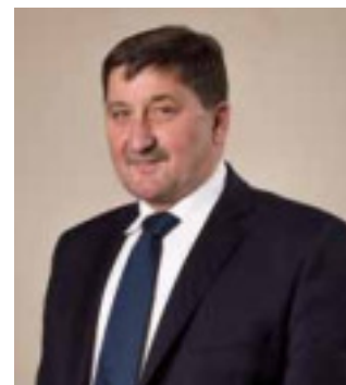
Wójt Gminy Ciasna

2. Budowa wodociągu łączącego nowe ujęcia wody nr S1 i S1 z ujęciami istniejącymi S3 i S3A . Ujęcia nowe S1 i S2 położone są na