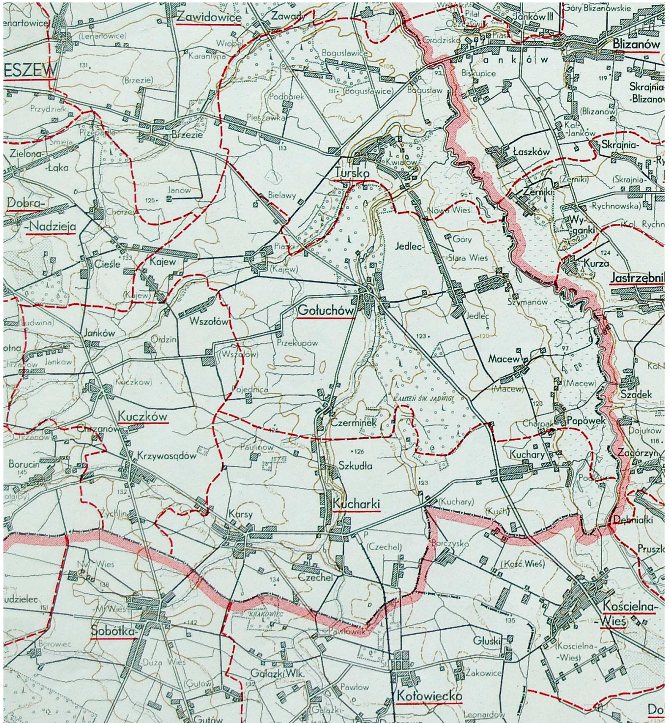
Podział na gromady w 1956 roku