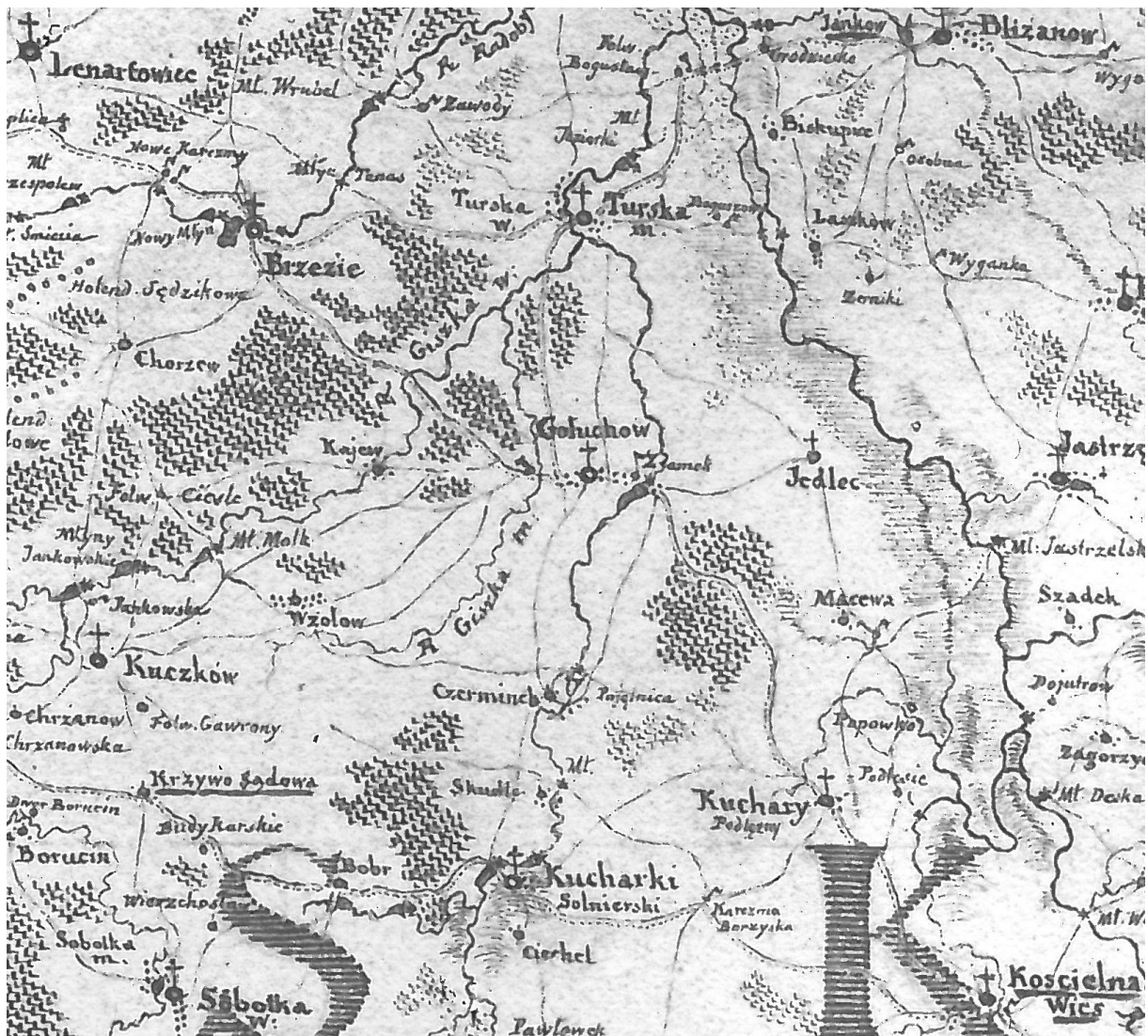
Fragment mapy Karola de Perthesa województwa kaliskiego z około 1790 roku

Obszary współczesnej Gminy pierwotnie związane były z państwem polskim - I Rzeczpospolitą, wchodziły w skład staropolskiego województwa kaliskiego i powiatu kaliskiego. W wyniku rozbiorów Polski Wielkopolska znalazła się w państwie pruskim i następnie niemieckim 1 . Stanowiła oddzielną prowincję zwaną Wielkim Księstwem Poznańskim, podzieloną na powiaty, w tym powiat pleszewski z Gołuchowem. Granica między zaborami pruskim i rosyjskim przebiegała wzdłuż obecnych wschodnich granic Gminy Gołuchów.