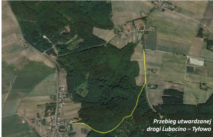
Przebieg utwardzanej drogi Lubocino – Tyłowo

Jak tylko warunki pogodowe pozwolą, ruszą prace związane z urządzeniem drogi łączącej wieś Lubocino i Tyłowo. Droga (1,5 km) zostanie na całej długości wyłożona płytami drogowymi w ilości 2000 szt., które za darmo pozyskaliśmy z PGNiG S.A. z siedzibą w Warszawie. Inwestycję tę wspierają także finansowo Lasy Państwowe.