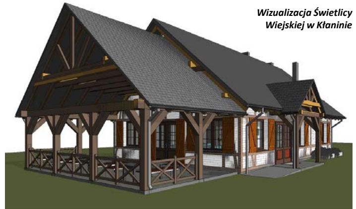
Wizualizacja Świetlicy Wiejskiej w Kłaninie

Gmina Krokowa za pośrednictwem Krokowskiego Centrum Kultury pozyskała dofinansowanie unijne na dwa zadania: Przebudowy zejścia na plażę nr 33 w miejscowości Białogóra oraz budowy świetlicy wiejskiej w Kłaninie. Obecnie oczekujemy na podpisanie umowy w Urzędzie Marszałkowskim. Prace obu inwestycji powinny rozpocząć się w przyszłym roku.