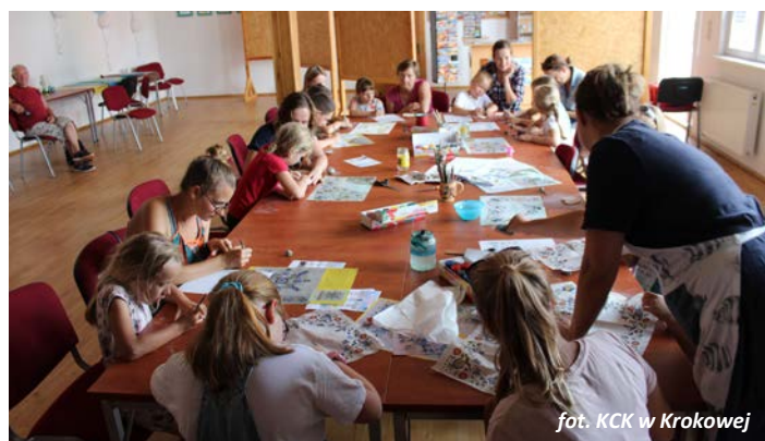
fol. KCK w Krokowej

Dofinansowanie w przypadku obu projektów pochodzi ze środków Ministra Kultury i Dziedzictwa Narodowego pochodzących z Funduszu Promocji Kultury.