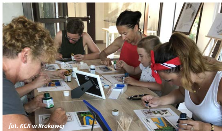
fol. KCK w Krokowej