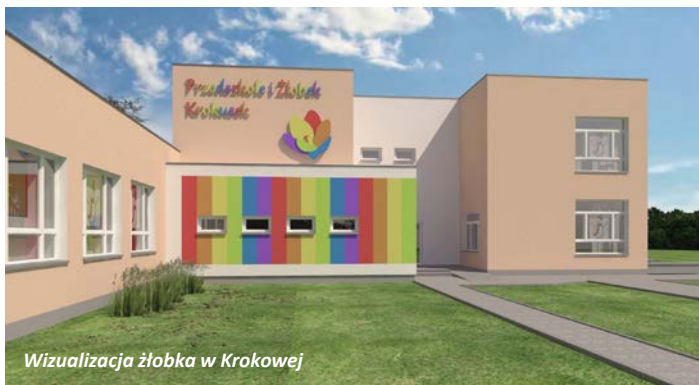
Wizualizacja żłobka w Krokowej

Udało się! Wniosek o dofinansowanie dotyczący utworzenia samorządowego żłobka w Krokowej został wybrany do dofinansowania - zajęliśmy 5 miejsce w konkursie. Będziemy jeszcze składać wniosek do rządowego Programu "Maluch" na dodatkowe wsparcie inwestycji. Wszystkie koszty związane z realizacją inwestycją będą pochodziły ze źródeł zewnętrznych! Żłobek, który będzie umiejscowiony nad naszym gminnym przedszkolem zacznie funkcjonować od września 2019 r.