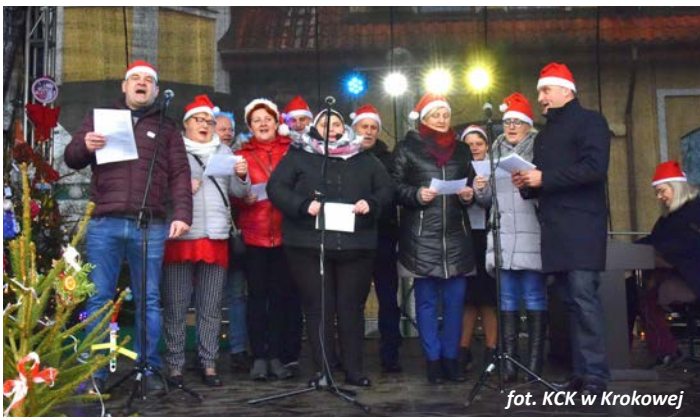
fol. KCK w Krokowej