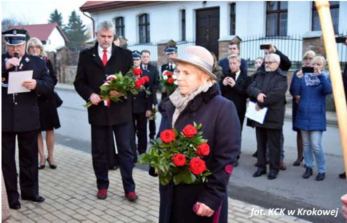
fol. KCK w Krokowej

10 listopada mieszkańcy zgromadzili się przy Domu Kultury w Sławoszynie chcąc uczcić odsłonięcie tablicy pamiątkowej ku czci mieszkańców Sławoszyna pomordowanych w Piaśnicy. Następnie wszyscy uczestnicy wydarzenia zostali zaproszeni na wieczornicę z okazji 100-lecia Odzyskania Niepodległości. Na scenie wystąpił zespół „Ale Babki”.