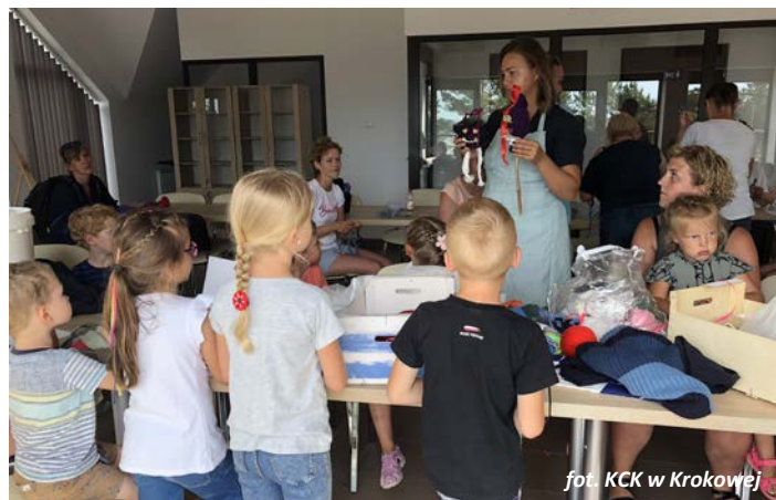
fol. KCK w Krokowej