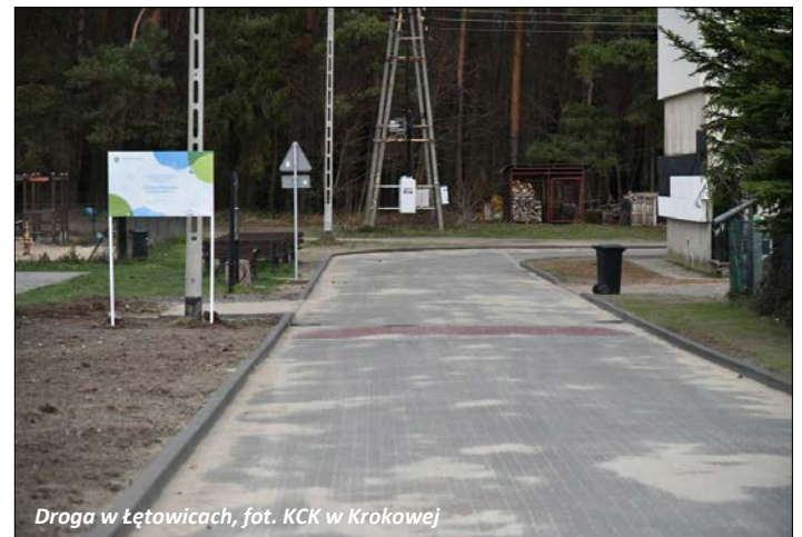
Druga w Łętowicach

Od końca lata wykonywaliśmy oczekiwane długo i cierpliwie przez naszych mieszkańców inwestycje drogowe. Dzięki gruntownej przebudowie nowy charakter, również ten estetyczny otrzymały: część ulicy Leśnej w Łętowicach oraz ul. Ogrodowa i Łubinowa w miejscowości Żarnowiec. W ramach zadania, jak to zwykle bywa, oprócz nawierzchni wykonano kanalizację deszczową oraz wymieniono stare cementowo-azbestowe sieci wodociągowe. Oba zadania kosztowały łącznie niemal 1,7 mln zł - gmina dołożyła tylko niespełna 12%, resztę stanowiły środki pozyskane, tj. środki rządowe, środki Marszałka Województwa, Program Wsparcia Rozwoju Gmin Lokalizacyjnych PGE EJ1.