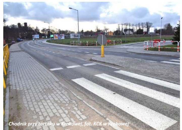
Chodnik przy tartaku w Krokowej

Dobra wiadomość przede wszystkim dla mieszkańców Krokowej, Minkowic i Lisewa. Niedawno zakończono prace przy odbudowie chodnika, który łączył wsie Krokowa i Minkowice, a który musiał zostać zdemontowany przy przebudowie drogi w okolicach nowego obiektu handlowego. Dzięki tej inwestycji bezpieczna komunikacja piesza znowu została przywrócona.